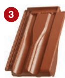
3 taška okrajová pravá