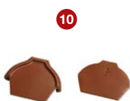
10 ukončení hřebenáče č. 2 vrchní / spodní