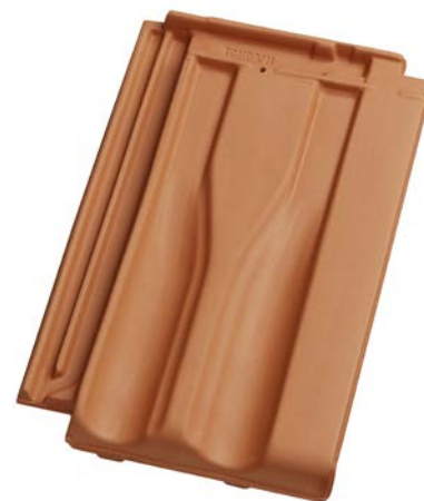
Rozměry základní tašky [mm]