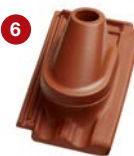
6 anténní komplet