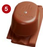
5 komplet pro odvětrání