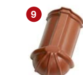
9 ukončení hřebenáče nárožní