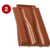
2 taška okrajová levá