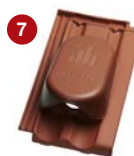
7 solární komplet