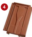
4 taška větrací 15 cm 2