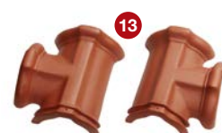
13 rozdělovací hřebenáč T levý / pravý